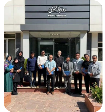
بازدید هنرمندان نیشابور از مجتمع فولاد خراسان