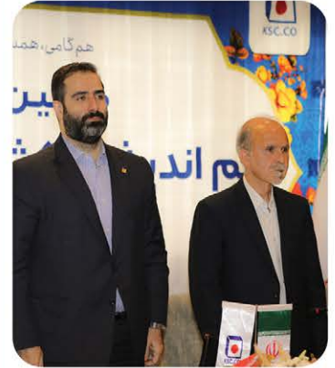
مدیرعامل مجتمع فولاد خراسان: