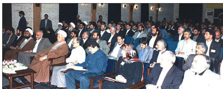
«حضور رئیس فقید مجمع تشخیص مصلحت نظام (رئیس جمهور وقت) در سالن اجتماعات فولاد خراسان و در مراسم کلنگ زنی مجتمع - سال ۱۳۷۶»

کلنگ احداث مجتمع فولاد خراسان در اواخر دوران ریاست جمهوری آیت... هاشمی رفسنجانی در سال ۱۳۷۶ و توسط خود ایشان بر زمین زده شد. ایشان در مراسمی در باره ضرورت احداث مجتمع فولاد خراسان، با توجه به محدودیت های منابع مالی و تردیدهایی که درباره ضرورت اجرای طرح ها مطرح می