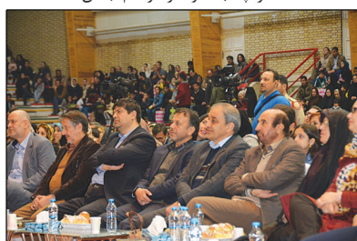
حضور ارزشمند اعضای محترم هیات مدیره فولاد خراسان در جشن میلاد نبی اکرم(ص)