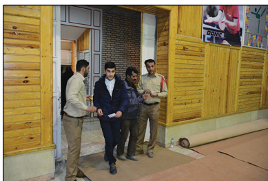
همکاری صمیمانه ی پرسنل واحد انتظامات در برگزاری مراسم