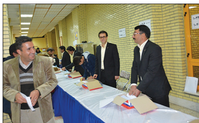
همکاران پرتلاش منابع انسانی در حال سازماندهی ورود خانواده کارکنان به مراسم

علی(ع)، پذیرایی از کلیه مهمانان، تقدیر از دانش پژوهان و اهدای هدایای آنان و... از بخش های دیگر این برنامه به یادماندنی بود. واحد روابط عمومی از همه همکاران و خانواده های محترم ایشان تقاضا دارد دیدگاه های ارزنده و پیشنهادهای خود را در باره این برنامه یا مراجعه به صفحه نخست وب سایت شرکت و مشارکت در نظرسنجی مربوطه ارایه و در برگزاری هر چه بهتر برنامه های آتی یاریگر ما باشند.