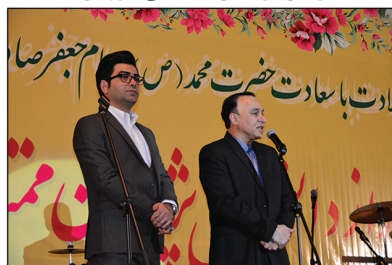
خیر مقدم مدیر روابط عمومی به مهمانان