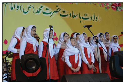
اجرای سرود توسط گروه دانش آموزان