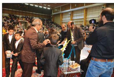
تقدیر از دانش پژوهان با حضور فرماندار نیشابور و مدیرعامل فولاد خراسان