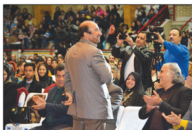
تشویق و قدردانی حضار از مدیرعامل مجتمع