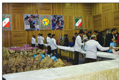
توزیع بسته های پذیرایی توسط همکاران پر تلاش واحد خدمات