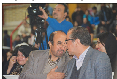
حضور نماینده مردم نیشابور در مجلس در جشن خانواده بزرگ فولاد