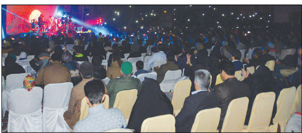
استقبال قریب به ۷۰۰۰ تن از اعضای خانواده فولاد از برنامه جشن میلاد حضرت رسول(ص) و تقدیر از دانش پژوهان ممتاز