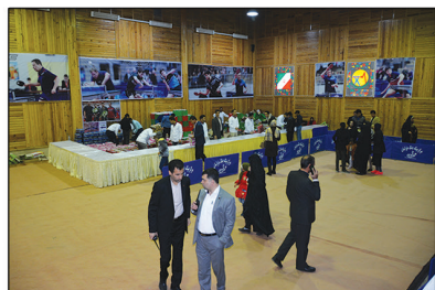
حضور موثر همکاران واحدهای حراست و منابع انسانی در ساماندهی، کنترل و نیز هماهنگی پذیرایی