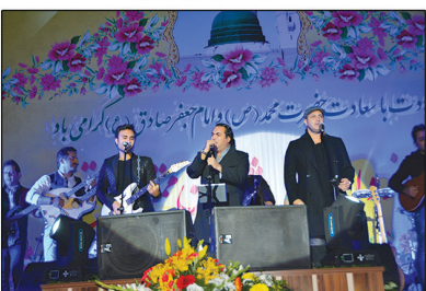
اجرای موسیقی پاپ توسط گروه «سون»