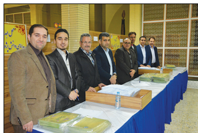
همکاری صمیمانه رابطان رسانه ای شرکت در برگزاری هر چه باشکوه تر مراسم جشن