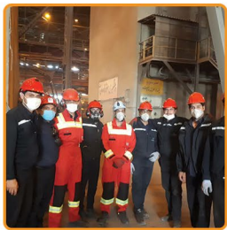
همزمان با هفتم مهر ماه، روز «ایمنی و آتش نشانی» اعلام شد:

بهره برداری از سازه مانور امداد و نجات در ارتفاع در فولاد خراسان