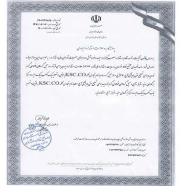
پروانه استاندارد دو صلاحیت آزمایشگاه همکار فولاد خراسان تمدید شد